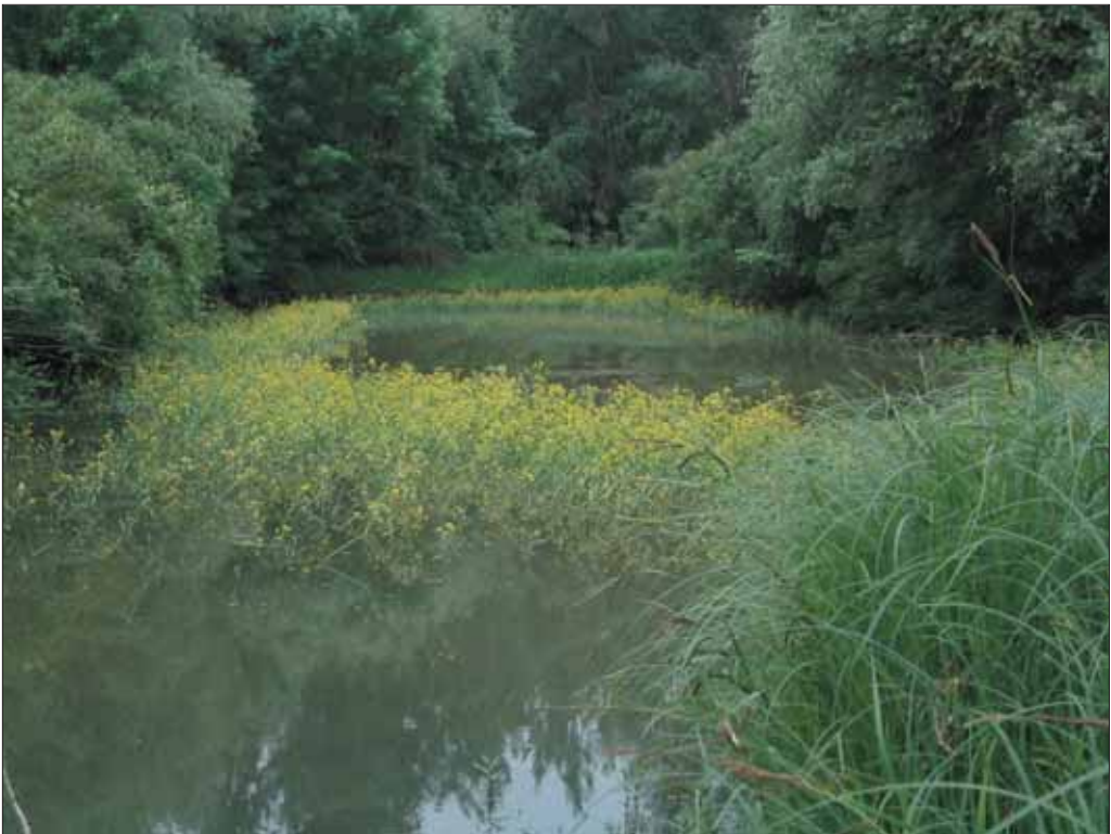
A kubikgödörökben megreked a tavaszi áradás vize, élő-, szaporodó- és táplálkozóhelyet kínálva a vízhez kötődő élővilág számára

Az Anyita-fok helyreállításával kialakítjuk a főmeder és a tó rendszeres és szabályozható kapcsolatát. A mintegy 100 hektáros területen a mozaikosság elősegítésére fűzek és extenzív gyümölcsfajták telepítésére kerül sor. A gyepterminológusok állományának megőrzését magyar szürke marhák legeltetése biztosítja.