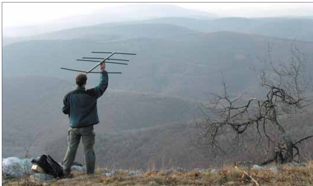
Rádiós nyomkövetés a Bükk hegységben

A fészkelő parlagisas-párok 2003-as és 2004-es elhelyezkedését digitális térképen ábrázoltuk térinformatikai módszerrel. Ezt összevetettük a javasolt különleges madárvédelmi területek határai-