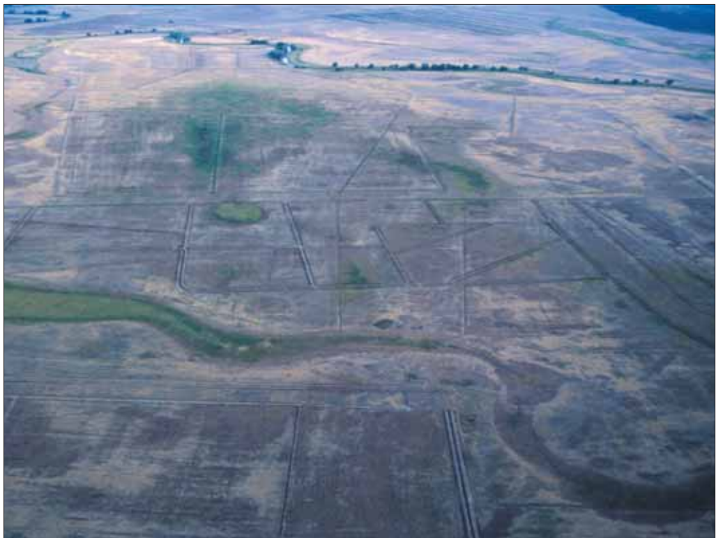
A pusztát feldaraboló egykori öntözőrendszer Szelencés-pusztán (háttérben a Hortobágy folyó)

A tájrehabilitációval az élőhelyvédelmi irányelv kiemelt jelentőségű élőhelytípusait, a szikes pusztákat és mocsarakat kívánjuk hosszú távon megőrizni. A kiválasztott terület ennek az élőhelytípusnak a legnagyobb összefüggő hazai képviselője, szántózárványok nélküli természetes szikes puszta.