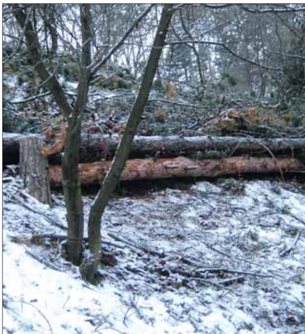
A kidöntött feketefenyőtörzsek egy részéből eróziófogó gátak épülnek

A vadkizárásos vizsgálatokhoz kiépítettünk három további bekerített mintaterületet és rendbe hoztuk a téli jégtörés által károsított mintaterületeket. Ennek eredményeként minden vegetációtípusban (bükkös, gyertyános-tölgyes, törmelékeltő erdő, erdőszegély, cserjésedő sztyepprét, sziklagyep) 2-2 bekerített mintaterület és 2-2 kontroll parcella található. A pilisi len monitoringhoz elkészítettük a faj élőhelyének 1:200 méretarányú geodéziai térképét.