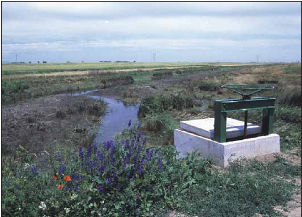
Az Ős-Csincse medrében elvezetett Tiszavalki-főcsatornába épített vízvisszatartó mű

A kialakítandó vízkormányzó rendszer működése során az ökológiai szempontból szükséges mennyiségű belvizet visszatartjuk a területen a korábban más célra épült belvízelvezető rendszer egyes elemeinek és az új műtárgyaknak a segítségével. A víz a természetes mélyületekben fokozatosan szétterül, amelyeket természetes vízfolyások vagy mesterséges csatornák segítségével kötünk össze egymással. A mélyületek közötti vízmozgást a projekt során megépítendő vízkormányzó művek (zsilipek, fenékküszöbök) segítségével tesszük szabályozhatóvá. Ez nem más, mint a hajdan jól működő fokrendszer mai viszonyokhoz alkalmazott változata.