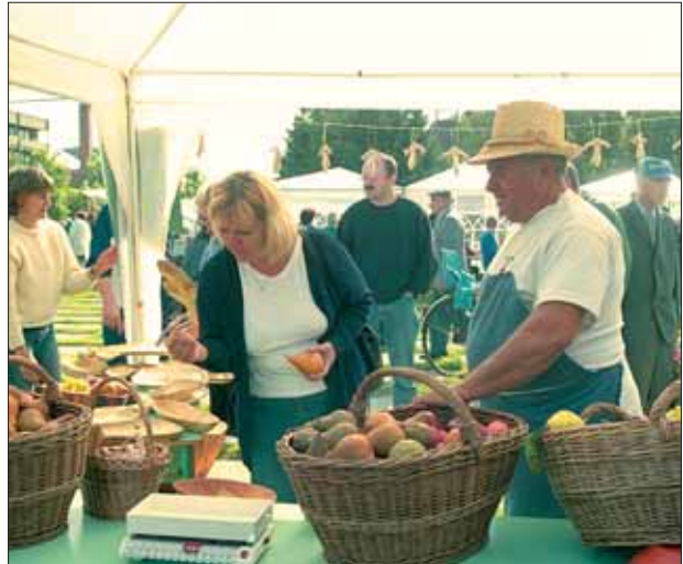
Az ártéri termékeket bemutató kóstoló és vásár megismerteti a fogyasztókkal a természetbarát gazdálkodás „gyümölcsseit”

A projekt természetvédelmi eredményein túl a teljes projektidőszakot végigkísérő kommunikációs tevékenység is nagy jelentőségű a célok elérésében. Eddig elkészült a projektet bemutató részletes kiadvány, bő információkkal szolgál a weboldal is, valamint több rendezvényen tájékoztattuk a térség gazdálkodóit, hogy milyen gazdálkodási módokat folytathatnak természetkímélő módon. A három alkalommal megrendezett őszi fesztivál a javasolt tájhasználat által előállított termékeket mutatta be, a sajtó folyamatos tájékoztatása pedig a projekt céljainak és eredményeinek széleskörű terjesztését segíti.