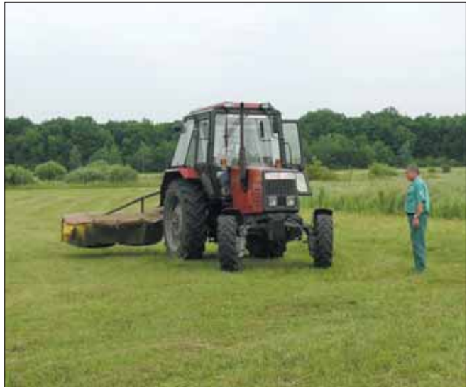
A Jónás-rész projekterület kaszálása

A területek botanikai feltérképezése megtörtént, és élőhelytérkép készült 1:5000 méretarányban. A munka során felvételtek a terület flóráját, és a növényzet állapotát befolyásoló tényezőket (művelési ágak, veszélyforrások, inváziós fajok stb.). Külön feljegyeztük a védett növények elterjedését. Minden élőhelyfoltról digitális felvételt készítettünk, a fontosabb információkat (pl. védett és/vagy ritka fajok előfordulása) GPS segítségével rögzítettük.