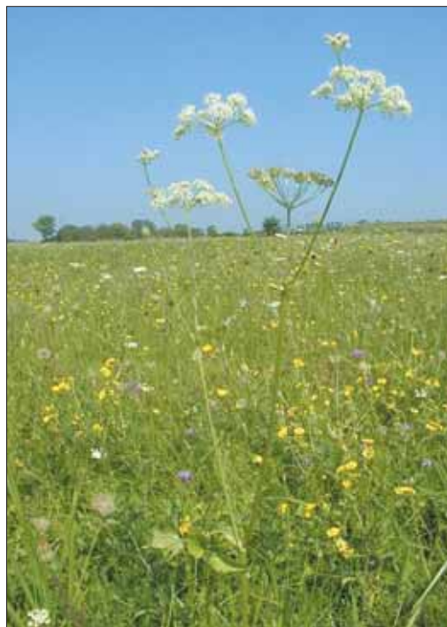
Réti angyalgökök ( Angelica palustris )

Ahol az állományok fennmaradását az állandó vagy időszakos vízhiány fenyegeti, ott a korábbi belvízmentesítések kártételének ellensúlyozására vízvisszatartást kívánunk végrehajtani (összesen 4 zsilipes és 28 földmunkás beruházás).