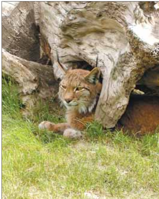
Hiúz ( Lynx lynx )

Feladatunk az állomány helyzetének pontos felmérése és változásainak folyamatos nyomon követése, az állatok megjelenésével felmerülő konfliktusok, problémák (kártérítés, kompenzáció) felmérése, illetve ezek kezeléséhez a jogszabályi háttér és a gyakorlati módszerek kialakítása. Ezzel párhuzamosan a nagyközönség és az érintettek folyamatos tájékoztatása folyik.