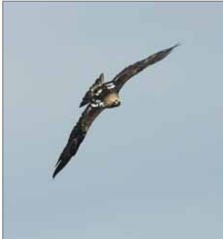
Parlagi sas ( Aquila heliaca )

tos tisztázása. Ebből a célból szisztematikus adatgyűjtést kezdtünk, mely a magyarországi állomány folyamatos monitorozása mellett tartalmaz rádiós nyomkövetést, földhasználati elemzéseket, valamint zsákmányállat-felmérést is. Az adatok térinformatikai értékelése alapján specifikus élőhely-kezelési javaslatokat kívánunk elkészíteni a parlagi sas védelme érdekében. A kidolgozott javaslatokat a magyarországi nemzeti-park-igazgatóságok figyelmébe ajánljuk az érzékeny természeti területekre (ÉTT) vonatkozó általános élőhely-kezelési tervek készítésénél.