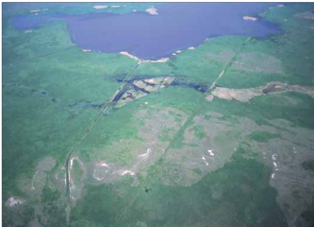
Nagyszéklápa árasztás: működnek a vízviszatarató műtárgyak

A vizes élőhelyekhez kötődő növénytársulások már az üzemelés első évében újra életre keltek. A kora tavasszal átvonuló vadludak száma tízezres nagyságrendű volt. Jelentősen megnőtt a területen ősszel megpihenő darvak száma, és közel száz az átnyaraló példányok száma.