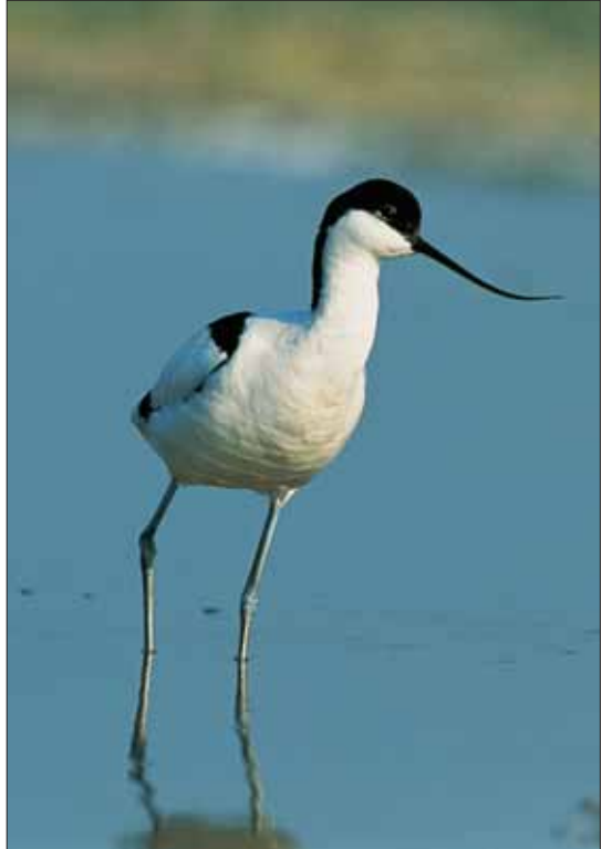
Gulipán ( Recurvirostra avosetta )

2003. január 1-jétől a területen folyamatos és összehangolt monitorozás folyik. A botanikai és rovarügyi monitorozás március és október között történik, míg a minőségi és mennyiségi madártani felvételezések egész évben folynak. 2003-ban a munkálatok megkezdése előtt elvégeztük az alaplapot-felméréseket. Elkészítettük a terület vegetációtérképét, felmértük a kiválasztott indikátor rovarcsoportokat és a területen fészkelő, valamint az átvonuló madárfajokat. Külön mintaterületeket jelöltünk ki a legelés hatásának vizsgálatára, ahol táplálékbázis-vizsgálatokat is végzünk. 2003-ban