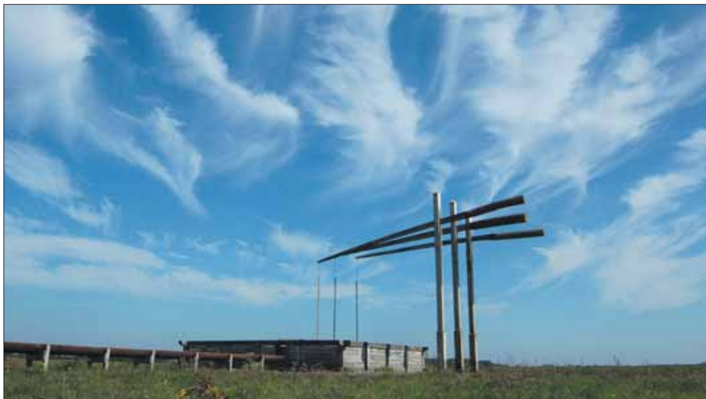
Nagy-vókonyai háromgémű Rózsa-kút

A legfontosabb feladatunk egy 200 hektáros vizes élőhely rekonstrukciója és az ehhez kapcsolódó földmunkák kivitelezése, valamint egy 1200 hektáros szikes puszta helyreállítása. Utóbbi esetben az egykori rizstelepek felszámolása érdekében közel 90 kilométer csatorna- és gátrendszer, valamint 300 darab zsilip megszüntetését végezzük el vállalkozók bevonásával. Felszámoljuk továbbá a pusztát elborító nem őshonos bokrokat és cserjéket (2000 példány). Az egységes hortobágyi táj megőrzése érdekében felújítjuk a területen található pásztorépületeket és gémeskutakat. A régi háziállat-fajták állományát növeljük 1040 példánnyal. Mivel a területen a túllegeltetés a cél, ezért nem kaszálunk, hanem az állatok téli takarmányát a pusztát szegélyező szántóterületről biztosítjuk, ahol 150 hektáron lucernát telepítettünk. A terület bemutatása érdekében két megfigyelőtornyot építünk és folyamatos terepi előadásokat tartunk. Az eredményeket cikkekben, kiadványokban, valamint egy filmben kívánjuk bemutatni.