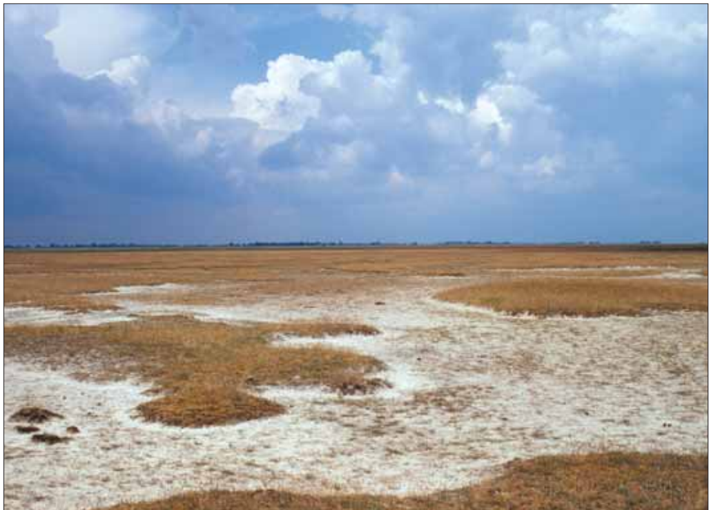
Természetes állapotú padkás szikes puszta Angyalházán

A munkák tervezésekor és a kivitelezés megkezdése előtt részletes alapállapot-felmérést végeztünk a projekthelyszíneken. 2004-től az elvégzett beavatkozások természetvédelmi eredményességét több élőlénycsoportra kiterjedő (botanikai, zoológiai) monitorozó programmal értékeljük.