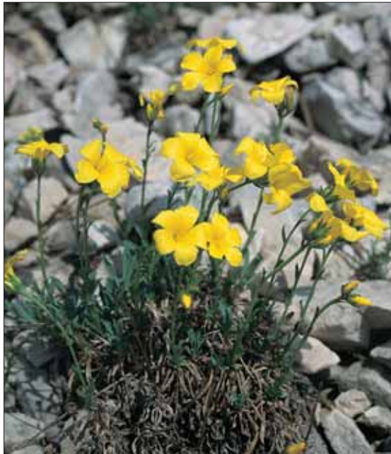
Dolomiten ( Linum dolomiticum )

konfliktusok csökkentése és az ismeret-terjesztés érdekében környezeti nevelőt foglalkoztatunk, információs táblákat helyezünk ki, illetve kiadványokat jelentetünk meg. A munka sikere érdekében fejlesztjük a terület őrzését is. Az élőhely-rekonstrukciós beavatkozások hatásait éves monitoring-jellegű kutatásokkal vizsgáljuk.