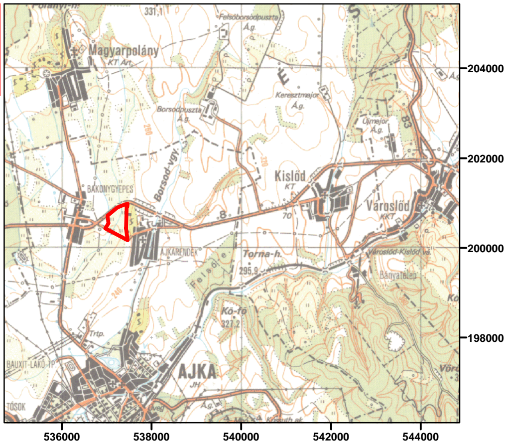
M = 1 : 100 000

A terület elhelyezkedését bemutató térkép nem képezi részét a 30/2005. (XII. 15.) KvVM rendeletnek, a felhasználók tájékoztatása céljából csatoltuk a dokumentumhoz.