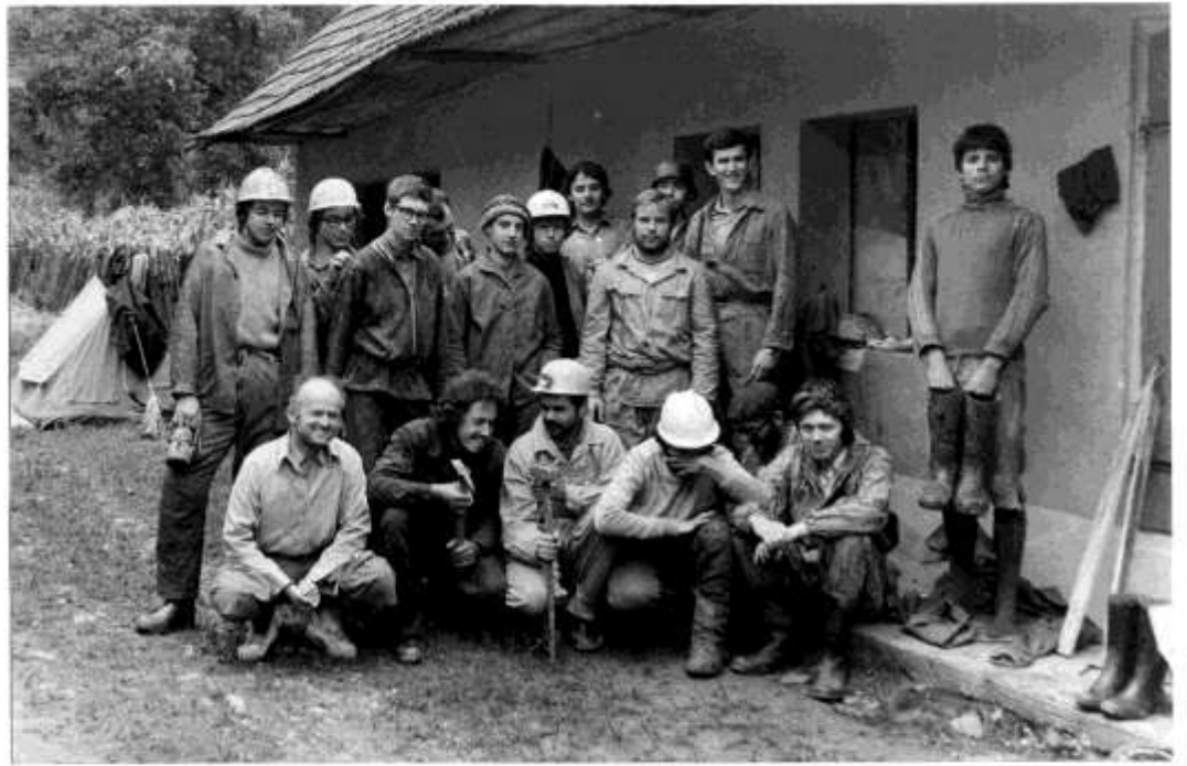
Csoportunk tagjai. A szögligeti kutatótáborban 1978. augusztus