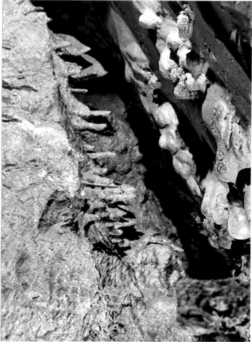
a csepegő víz munkája