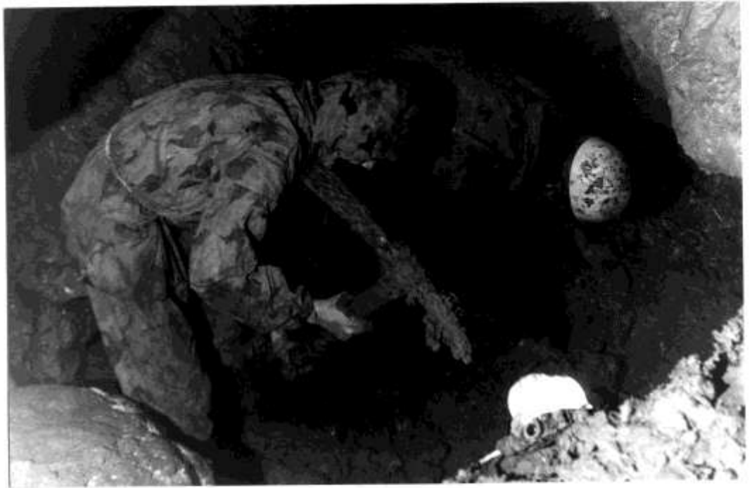
I.sz. szifon tégítése