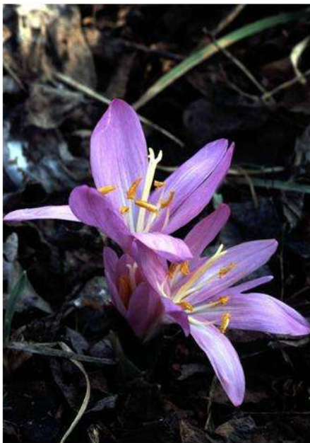
1. kép: Virágzó egyhajúvirág