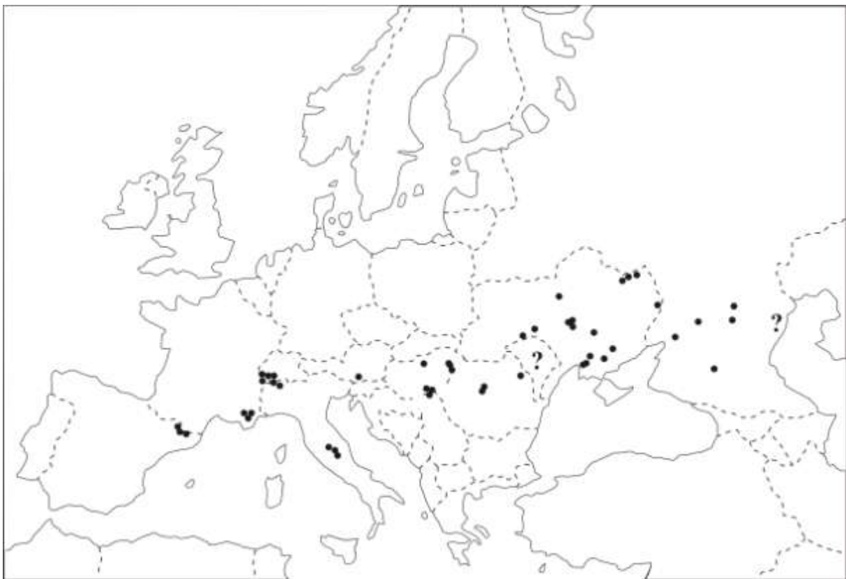
1. ábra. Az egyhajúvirág elterjedése (eredeti). Azokat a területeket, ahonnan nincs pontos információ, kérdőjelek mutatják.

A korábbiakban említettnek megfelelően az egyhajúvirág európai elterjedésű faj, amely előfordulási területének legnyugatabbi pontjai a Keleti-Pireneusokban, míg legkeletibb pontjai a Volga-folyó mentén találhatóak. Areájának ponttérképe az 1. ábrán látható. Az elterjedési terület nyugati részén nem veszélyeztetett, egyedszámai nem alacsonyak Spanyolországban, Franciaországban, Olaszországban, Svájcban. Az area többi részén veszélyeztetett, illetve nem ismert a helyzete a Moldáviai Köztársaságban és Dagesztánban.