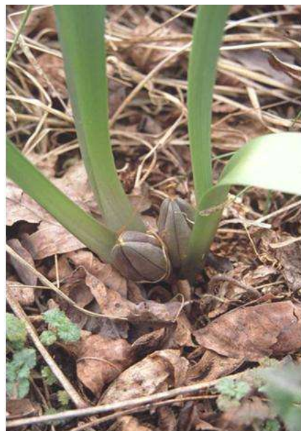
2. kép: Terméses egyhajúvirág (május)